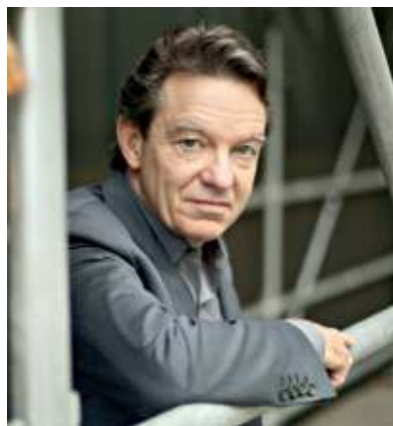
▲ L'autore Lawrence Wright, 72 anni, ha vinto il premio Pulitzer con Le altissime torri , tradotto in Italia da Adelphi

Come andrà? «Dipenderà dalla scelta del candidato democratico. Se sarà un moderato il Texas virerà a sinistra».